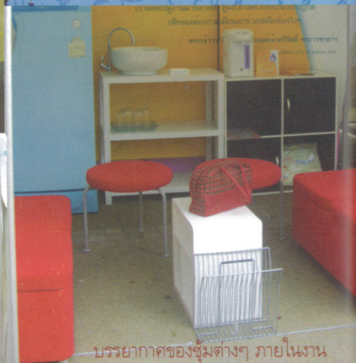
บรรยากาศของซุ้มต่างๆ ภายในงาน