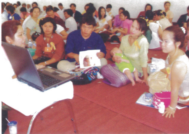
คุณแม่แตงชดระอเฝ้าเสด็จ