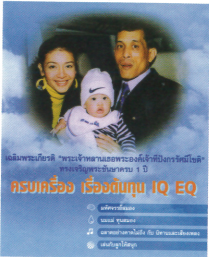
หนังสือ "ครบเครื่อง เรื่องต้นทุน IQ EQ"