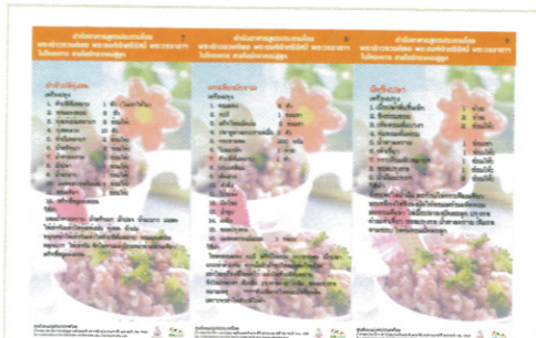
ตำรับอาหารสูตรประทาน โดยพระเจ้าวรวงศ์เธอ พระองค์เจ้าศรีรัศมิ์พระวรชายาฯ