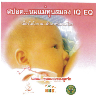
สปอดหัวใจ นมแม่ทุนสมอง IQ EQ