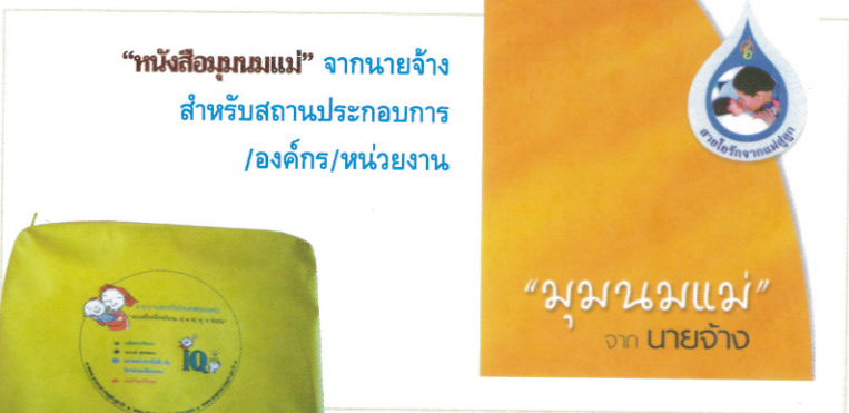
"นมแม่แม่" จากนายจ้าง สำหรับสถานประกอบการ /องค์กร/หน่วยงาน

ศูนย์นมแม่แห่งประเทศไทย กรมอนามัย กระทรวงสาธารณสุข และ สสส. ร่วมกันจัดทำ โดยได้รับพระบรมราชานุญาตจากสมเด็จพระบรมโอรสาธิราชฯ ให้เผยแพร่พระฉายาลักษณ์ได้ รับผิดชอบได้จัดทำเข้าร่วมโครงการ ซึ่งจะจัดทำสู่ 76 จังหวัดทั่วประเทศ (ใน 3 ปี)