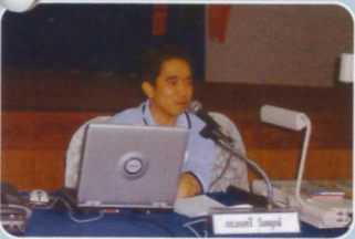
BREASTFEEDING and MEDICATION