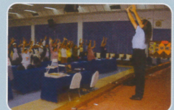
ออกกำลังกายยืดเส้นยืดสาย