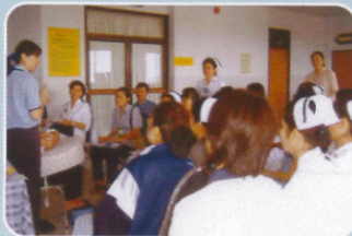
ฐานหลังคลอด