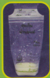
ถุงเก็บน้ำนมแม่

ทางบริษัทแจ้งว่าการวางขายตามร้านสะดวกซื้อ จะทำให้ต้นทุนสูงขึ้น ขอเวลาศึกษาดูตลาดอีกสักพัก ในขณะนี้ คลินิกนมแม่ หรือหน่วยงานใดที่ต้องการสั่งซื้อ ขอให้สั่งจากบริษัทโดยตรง (บริษัททานตะวันอุตสาหกรรม จำกัด) หมายเลขโทรศัพท์ 0-2273-8333 ราคาจำหน่ายประชาชน 25 ถุง/35 บาท เป็นถุงคุณภาพเดียวกับที่ส่งออกต่างประเทศ ซึ่งถ้ากลับมาขายเราจะราคาใบละ 5-6 บาท สอบถามจากบริษัทตนเองนะคะ และเพื่อเป็นการแก้ขัด... ขณะนี้ สามารถซื้อได้ที่ คลินิกนมแม่ รพ.ศิริราช สถาบันสุขภาพเด็กฯ และที่รพ.เจริญกรุง