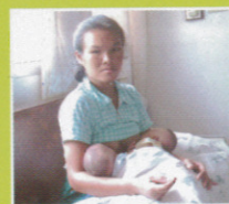
แม่ศยาม จ.ขอนแก่นเลี้ยงลูกด้วยนมแม่

แม่ศยามขอนแก่น คลอดเมื่อ 11 ส.ค. 2547 เลี้ยงลูกด้วยนมแม่ แรกเกิดน้ำหนักรวม 5,590 กรัม ตอนนี้น้ำหนัก 8 กก. แล้วแข็งแรง ทั้งแม่และลูก น่ายินดีค่ะ...จาก คุณหมอวิทยา จารุพูนผล ผู้อำนวยการ รพ.ขอนแก่น