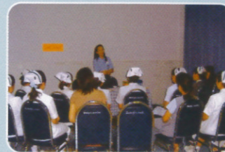
ฐานห้องฝากท้องครรภ์