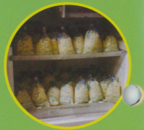
ขอขอบคุณ พญ.กุลกัญญา โชคไพบูลย์กิจ ที่อนุญาตให้เผยแพร่