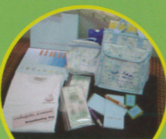
ชุดสนับสนุนแม่ทำงาน