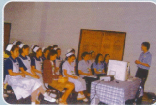
ฐานห้องคลอด