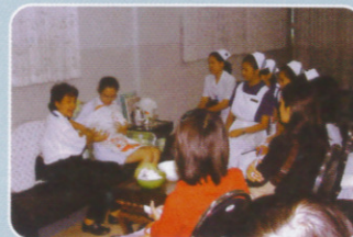
ฐานคลินิกนมแม่