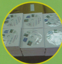
CD สวัสดิ บิบ-เก็บ-ตุน-น้ำนมแม่