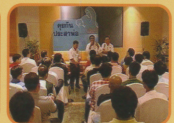
ถ่ายทอดทีวีช่อง 11 ส่องรอบ