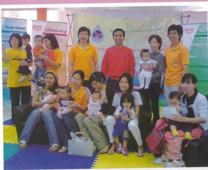
❖ อาจารย์สง่า ตามาพงษ์ กรมอนามัย และ หม่อมหลวง จันทร์กฤษณา ผลวิวัฒน์ ชวนแม่อาสาเสวนาให้ความรู้ ณ ห้างสรรพสินค้า เดอะมอลล์งามวงศ์วาน