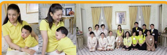
● 19 กรกฎาคม 2549 ผู้แทนศูนย์นมแม่ฯ เข้าเฝ้าขอประทานสัมภาษณ์ครั้งที่ 2