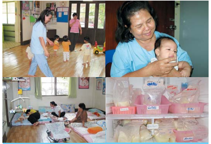
ศูนย์เด็กเล็กน่ายุติมุนนมแม่ในโรงพยาบาลลำปาง

นับว่าโรงพยาบาลลำปาง และเครือข่าย ได้เปิดหน้าต่างแห่งโอกาสของเด็กน้อยลำปางให้เริ่มต้นชีวิตได้ดีที่สุด มีโอกาสพัฒนาได้ยากไกล สมดังที่ทีมงานได้บอกกล่าวพวกเราจริงๆ ละ