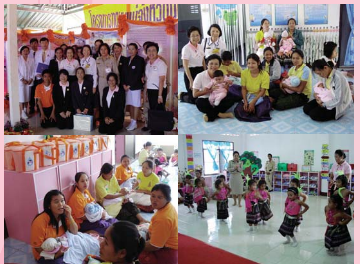
● 23 พฤศจิกายน 2550 จังหวัดมหาสารคาม (บ้านนาเรา)