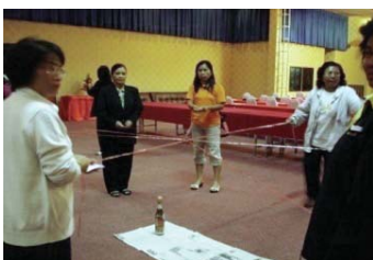
● สร้างการมีส่วนร่วมทุกกลุ่มอายุ โดยใช้เกมส์ไข่มุกเหมือนไขที่ต้องช่วยกันดูแลไม่ให้แตก