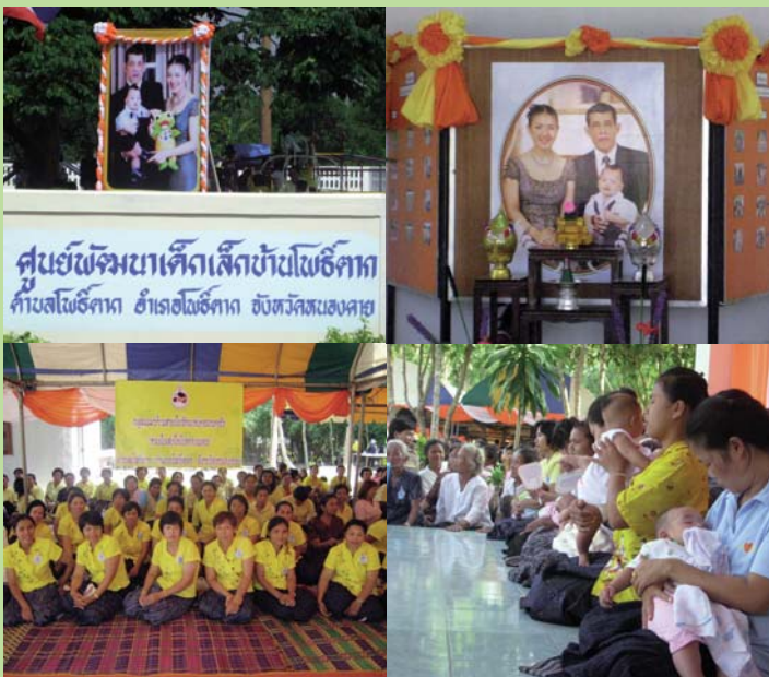
● 17 พ.ศ. 2551 โครงการสายใยรักแห่งครอบครัวที่ จังหวัดหนองคาย (บ่าย)