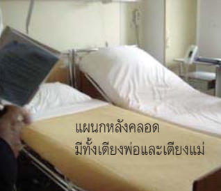
แผนกหลังคลอด มีทั้งเตียงพ่อและเตียงแม่