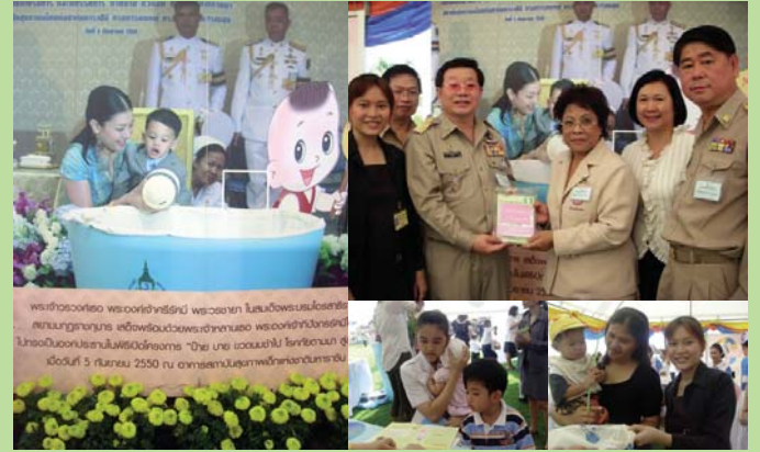
● 12 มกราคม 2551 ในพื้นที่โครงการ 904 วังคูเข้ทัย