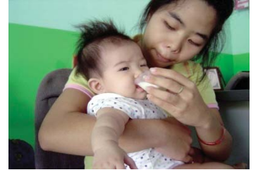
● พี่เลี้ยงเด็กกำลังป้อนนมแม่ ในศูนย์เด็กเล็กนำอยู่คุณแม่ ชุมชนป่าแดด