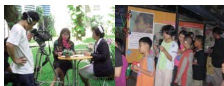
● สร้างกระแสสังคม