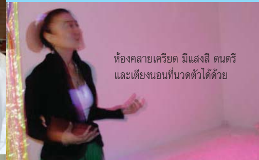
ห้องคลาโยครีโยด มีแสงสี ดนตรี และเตียงนอนที่นวดตัวได้ด้วย