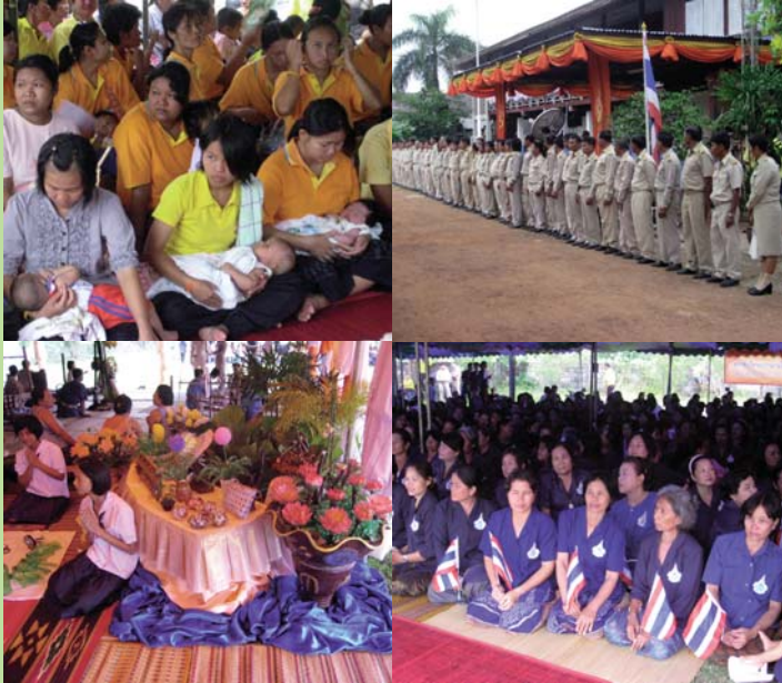
● 17 พฤษภาคม 2551 โครงการสายใยรักแห่งครอบครัวที่ จังหวัดอุดรธานี (เช้า)