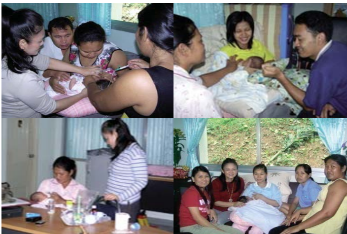
● แม่อาสาในกลุ่มนมแม่สมาคมภริยาทหารเรือฯ ผลัดเวรกันดูแลและให้บริการคลินิกนมแม่ 24 ชม.