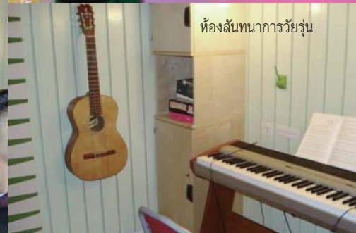
ห้องสนทนาการวิโยรูน