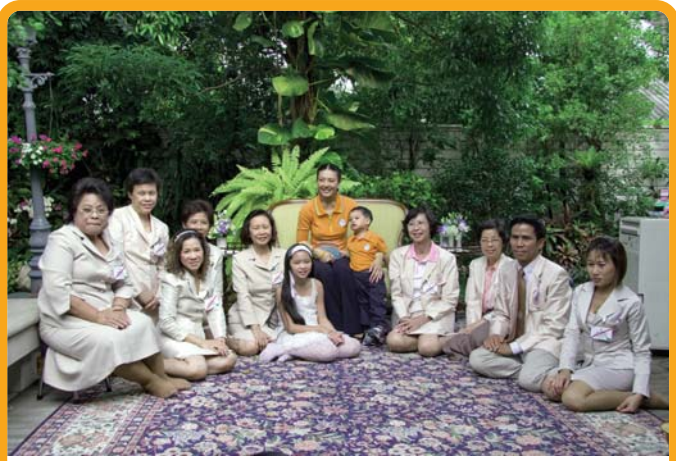
● 27 เมษายน 2551 ผู้แทนศูนย์นมแม่ฯ เข้าเฝ้าขอประทานสัมภาษณ์ ครั้งที่ 3