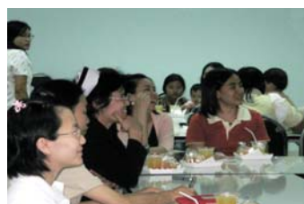
● สร้างพลังอำนาจแม่อาสาในการเยี่ยมมารดาหลังคลอด

นับว่ามหาวิทยาลัยขอนแก่น เป็นมหาวิทยาลัยแห่งแรก ที่ได้สร้างรูปแบบการส่งเสริมการเลี้ยงลูกด้วยนมแม่ที่เป็นระบบครบวงจร สำหรับชุมชนมหาวิทยาลัย ที่สามารถเป็นแบบอย่างให้กับชุมชนมหาวิทยาลัยอื่นๆ ได้ โดยเน้นเรื่องการให้ความรู้และทักษะอย่างถูกต้องเป็นประเด็นสำคัญ มีการให้ความรู้ เพิ่มพูนทักษะ และพัฒนาแม่อาสา เพื่อให้เป็นคนต้นแบบในระดับมหาวิทยาลัย เพราะประเด็นสำคัญยิ่ง คือมหาวิทยาลัยเป็นแหล่งการศึกษาเรียนรู้ บุคลากรมหาวิทยาลัย สามารถเป็นคนต้นแบบด้านการเลี้ยงลูกด้วยนมแม่ สามารถสร้างความเชื่อมั่น และสร้างทัศนคติที่ดีเรื่องนมแม่ให้กับสังคมโดยรวมได้สูง นักศึกษาในมหาวิทยาลัยโดยเฉพาะนักศึกษาด้านการแพทย์ พยาบาล สาธารณสุขจะได้ศึกษาเรียนรู้รูปแบบการส่งเสริมการเลี้ยงลูกด้วยนมแม่ มีทัศนคติที่ดีต่อการเลี้ยงลูกด้วยนมแม่ และนำไปใช้ได้จริงอย่างถูกต้องทั้งในการปฏิบัติงานเมื่อจบการศึกษาและในการใช้ชีวิตครอบครัวในอนาคต