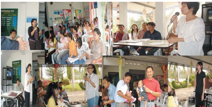
กิจกรรมการดำเนินงานร่วมกับเครือข่าย