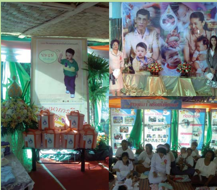
● 2 มิถุนายน 2551 โครงการสายใยรักแห่งครอบครัวที่ จังหวัดอุทัยธานี