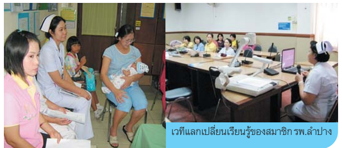
เวทีแลกเปลี่ยนเรียนรู้ของสมาชิก รพ.ลำปาง