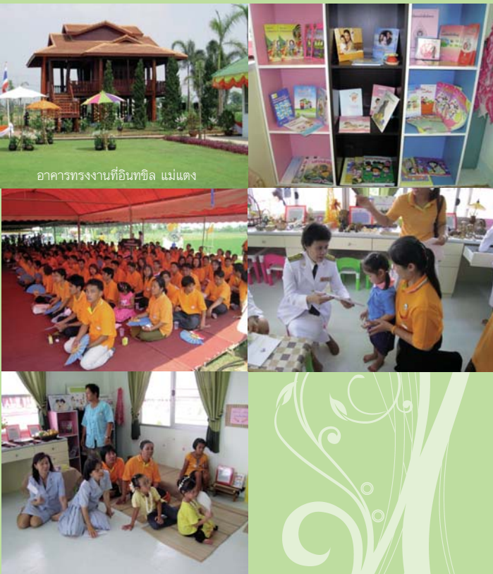
● 20 เมษายน 2551 ที่ตำบลอินทิล อ. แม่แตง จังหวัดเชียงใหม่ พื้นที่นำร่อง