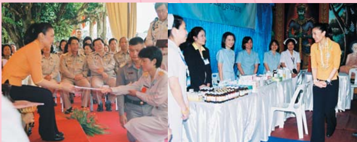
● 11 เมษายน 2550 เสด็จทอดพระเนตรและติดตามการดำเนินงานโครงการสายใยรักแห่งครอบครัว ณ บ้านปาง หมูที่ 7 ตำบลอินทิล อำเภอแม่แตง จังหวัดเชียงใหม่