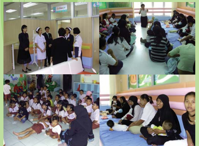
● 18 กุมภาพันธ์ 2551 ศูนย์พัฒนาเด็กก่อนวัยเรียน เขตหนองจอก, เขตมีนบุรี กรุงเทพมหานคร