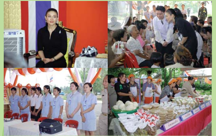
● 13 กุมภาพันธ์ 2551 เสด็จเยี่ยมโครงการฯ ณ จังหวัดสมุทรสาคร