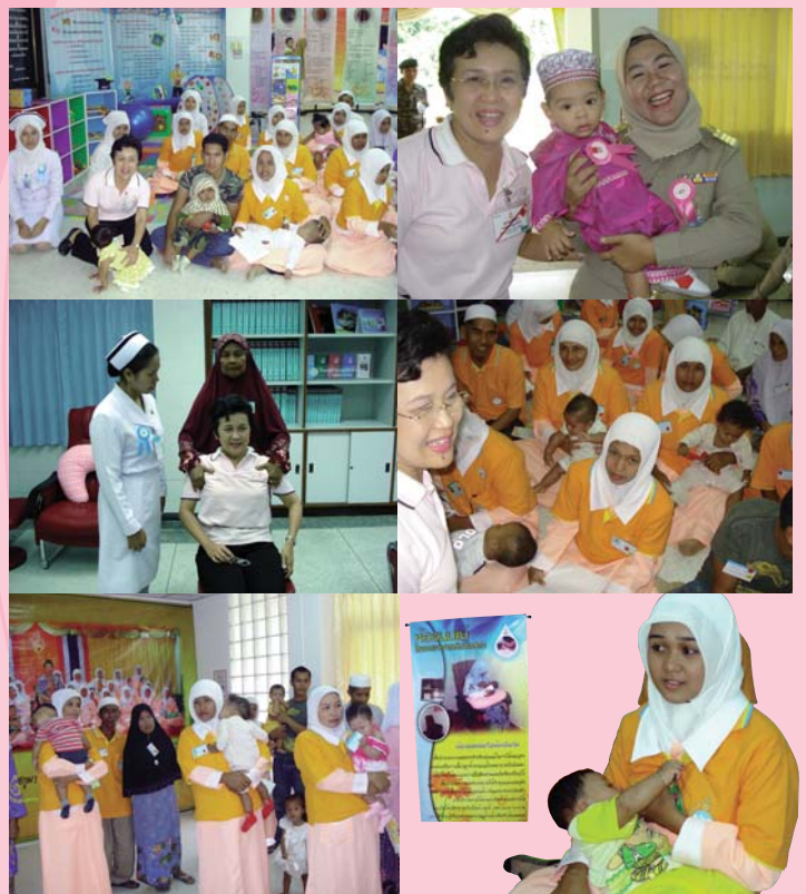
● 28 พฤศจิกายน 2550 บ้านนังงตา จังหวัดยะลา