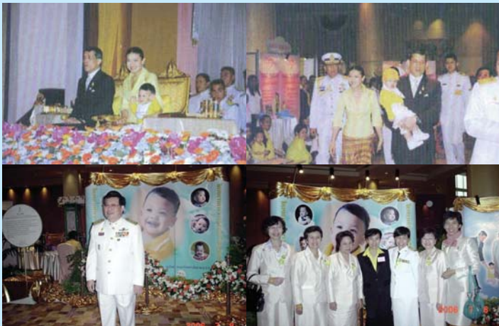
● 8 กรกฎาคม 2549 สมเด็จพระบรมโอรสาธิราชฯ สยามมกุฎราชกุมาร เสด็จพร้อมพระเจ้าวรวงศ์เธอ พระองค์เจ้าศรีรัศมิ์ พระวรชายาฯ และ “พระองค์ที่” ทรงเป็นองค์ประธานงาน “คาราวาน สายใยรักแห่งครอบครัว”