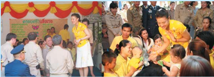
● 2 กรกฎาคม 2549 พระเจ้าวรวงศ์เธอ พระองค์เจ้าศรีรัศมิ์ พระวรชายาฯ เสด็จทอดพระเนตร และติดตามการดำเนินงานโครงการสายใยรักแห่งครอบครัว ณ บ้านหนองออน หมู่ที่ 10 ตำบลอินทิล อำเภอแม่แตง จังหวัดเชียงใหม่