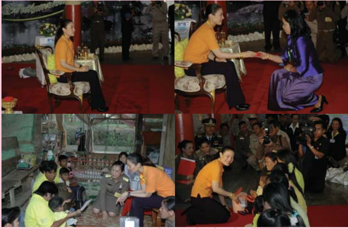
● 20 กุมภาพันธ์ 2550 เสด็จ อำเภอบางบาล จังหวัดอยุธยา