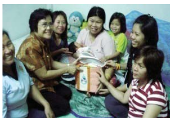
● เยี่ยมบ้านแม่ลูกหลังคลอด มอบกระเป๋านมแม่ (ต้นแบบจากของขวัญพระราชทาน ในโครงการสายใยรักแห่งครอบครัว)