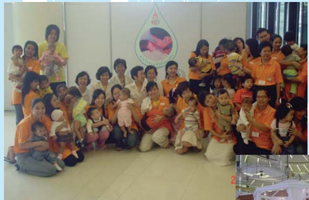
● 19 พฤศจิกายน 2549 Road show สายใยรักแห่งครอบครัว ณ สยามพารากอน