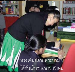
ทรงเซ็นต์ลายพระนามให้กับเด็กชายชาวสวีเดน