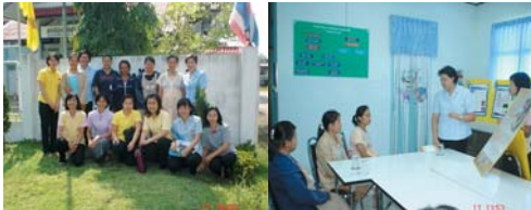
พัฒนาเครือข่ายในการส่งเสริมการเลี้ยงลูกด้วยนมแม่