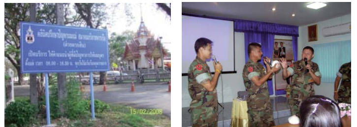
● ป้ายประชาสัมพันธ์คลินิกนมแม่ 24 ชั่วโมง