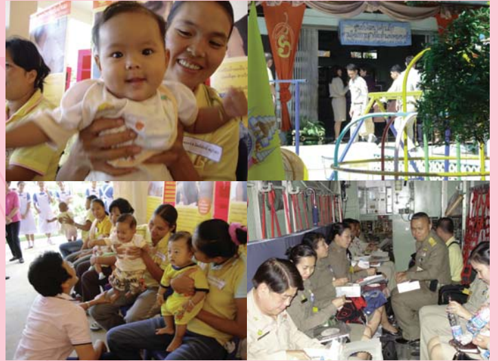
● 17 พฤศจิกายน 2550 จังหวัดอุดรดิตถ์ (บ้านน้ำริน)