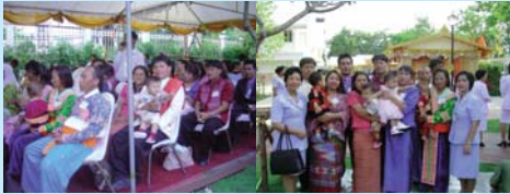
● สหายพระองค์ที่ 60 คน ทั่วประเทศเข้าเฝ้าฯ