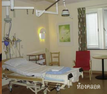
ห้องคลอด

UNICEF Convention on The rights of the child : “The child shall have the right from birth...to know and be cared for by his or her parents” (Article 7) การดูแลทารกแรกเกิดก่อนกำหนด แบบ Kangaroo ภายใต้แนวคิดหลัก 1. สิทธิเด็กตั้งแต่แรกเกิดที่จะได้รับการดูแลโดยพ่อแม่ 2. ทารกแรกเกิดก่อนกำหนดไม่ใช่ “Disease” (โรค) แต่การแยกทารกแรกเกิดก่อนกำหนดจากพ่อแม่ จะทำให้เกิด Disease