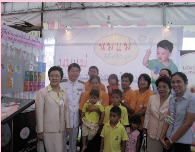
● 7 ธันวาคม 2550 รับเสด็จที่ อตก.