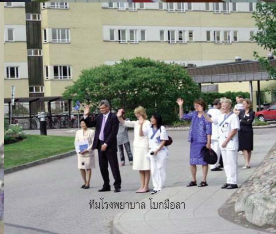
ทีมโรงพยาบาล โบกมือลา