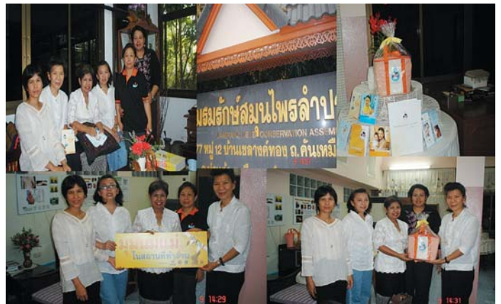
ความร่วมมือของชุมชนในการจัดตั้งมุนนมแม่