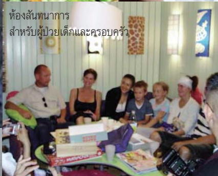
ห้องสนทนาสำหรับผู้ป่วยเด็กและครอบครัว