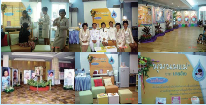
● 29 เมษายน 2549 วันคล้ายวันประสูติ “พระองค์ที่”