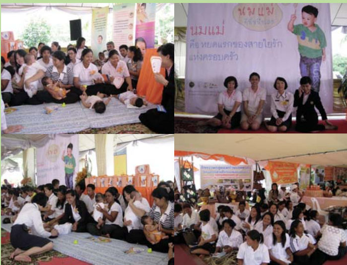
● 17 มีนาคม 2551 โครงการสายใยรักแห่งครอบครัวที่ จังหวัดนครศรีธรรมราช