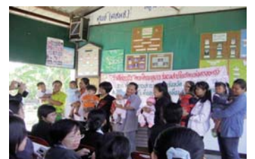
● พัฒนาศักยภาพ ของพยาบาล และมารดาให้มีทักษะการช่วยเด็กป่วยให้ดูนมแม่