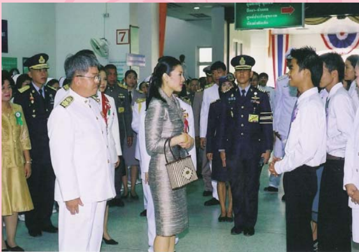
● 17 พฤษภาคม 2550 เสด็จเป็นประธานเปิดโครงการ ชูตนนมแม่ จังหวัดมหาสารคาม