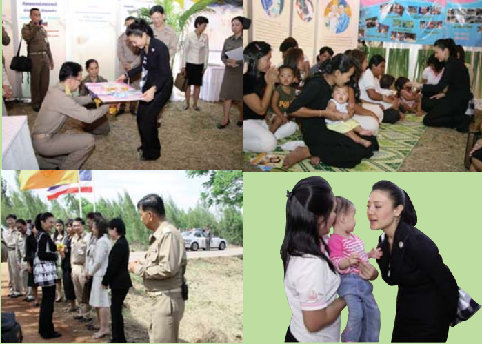
● 27 กุมภาพันธ์ 2551 เสด็จเยี่ยมโครงการฯ จังหวัดนครนายก