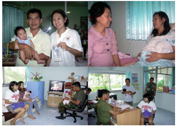
● ประชาชนทั่วไปมารับบริการคลินิกนมแม่ 24 ชม.