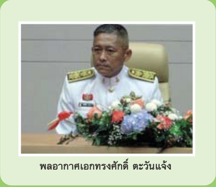
พลอากาศเอกทรงศักดิ์ ตะวันแจ้

พระเจ้าวรวงศ์เธอ พระองค์เจ้าศรีรัศมิ์ พระวรชายาฯ ต้องการให้ขวัญและกำลังใจแก่แม่อาสาผู้ปฏิบัติงานส่งเสริมการเลี้ยงลูกด้วยนมแม่ ที่ได้ส่งเสริมการเลี้ยงลูกด้วยนมแม่ให้แก่แม่ที่รู้จักและในชุมชน หลากหลาย วิธีเช่น การร่วมเสวนาแลกเปลี่ยนเรียนรู้เกี่ยวกับนมแม่ การให้คำปรึกษาทางโทรศัพท์และเว็บไซต์ การเยี่ยมแม่ที่บ้านที่มีปัญหา ร่วมกิจกรรมกับศูนย์นมแม่ฯ ในพื้นที่ทรงเสด็จ ในโครงการสายใยรักแห่งครอบครัว จึงทรงให้กระทรวงสาธารณสุขและศูนย์นมแม่ฯ ดำเนินการประสานแม่อาสาของ กรุงเทพมหานครฯ รับมอบของประทาน เมื่อวันที่ 2 พฤษภาคม 2551 เวลา 8.00 น.-10.00 น. ณ ห้องประชุมชัชวาทนเรนทร ชั้น 2 ตึกสำนักงานปลัดกระทรวงสาธารณสุข มีแม่อาสาจำนวน 44 คนมารับมอบของประทาน และมารับมอบของประทานแทน จำนวน 33 คน