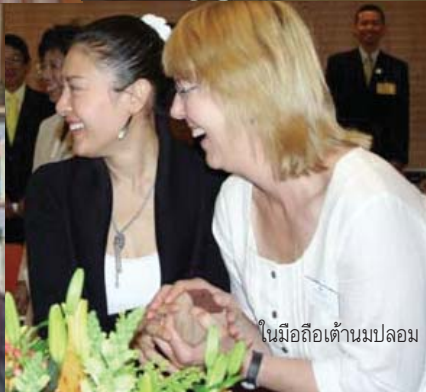
ในมือถือदानมปลอม