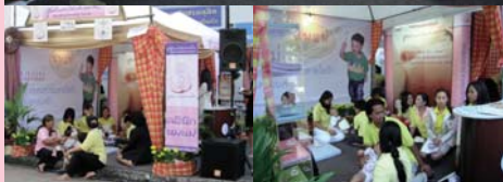
● 3 ธันวาคม 2550 เสด็จเยี่ยม ซอยโซดา กรุงเทพมหานคร