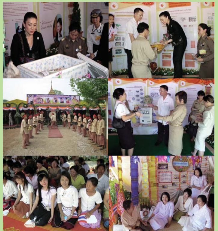
● 21 เมษายน 2551 โครงการสายใยรักแห่งครอบครัวที่ จังหวัดลำพูน